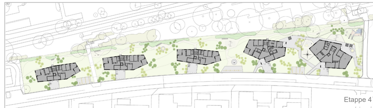
Übersicht Gebäude mit Umgebung, Etappen 4 und 5 (Trempland Landschaftsarchitekten GmbH, Zürich)