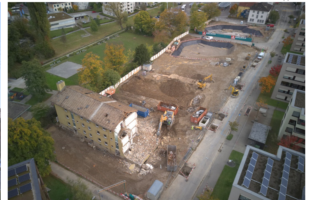
Abbruch best. Gebäude und Aushub für Etappe 5