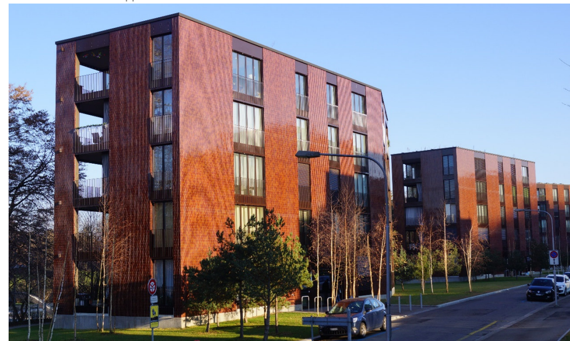
Ansicht Gebäude Etappe 4