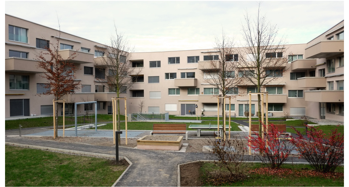
Innenhof zwischen den "Fingern".