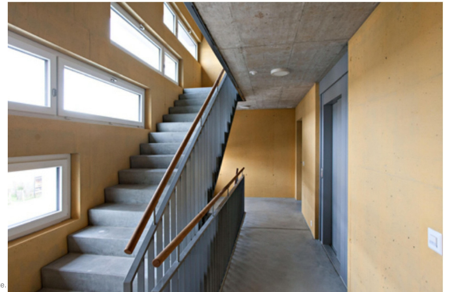
Beispiel für ein Treppenhaus auf der Nordseite.